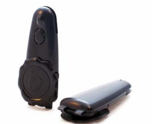
De PRO-SEAL TAG